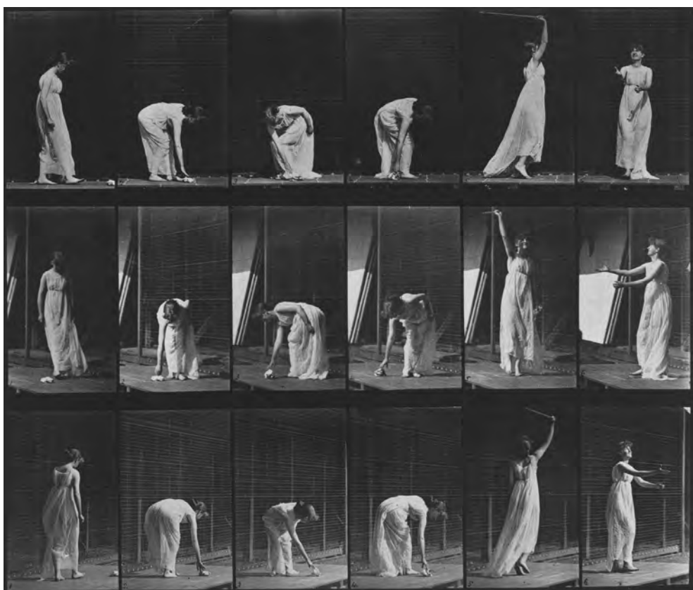
Abb. 3 Eadweard Muybridge, Animal Locomotion , Plate 503 [Woman Moving, ›Miscellaneous – stooping, etc.]. 1887. 25 × 29,5 cm. Amsterdam, Rijksmuseum