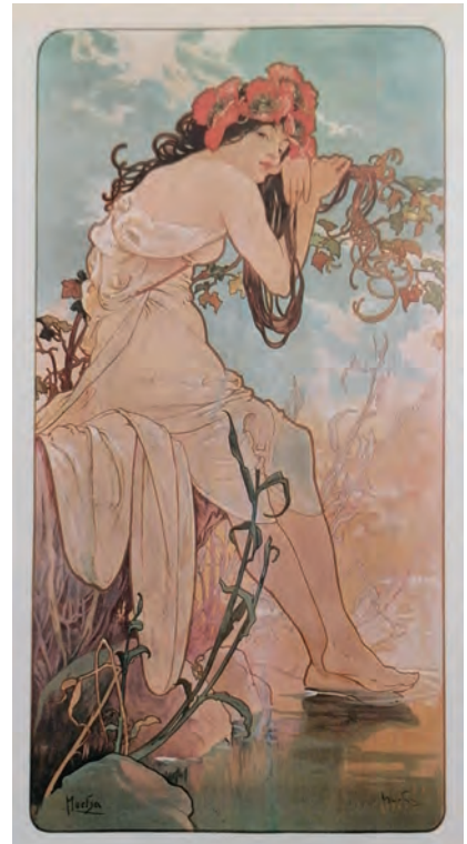
Abb. 1 Alfons Mucha, Die vier Jahreszeiten: Sommer. 1896. Farblithografie. 107,5 × 54 cm. London, Grosvenor Gallery

Der Körper und sein Alter wird zum Austragungsort zeitlicher Vorstellungen. Potenziert wird diese Aushandlung in literarischen und filmischen Figuren, wie etwa Zombies, Mumien oder Vampiren, welche linearen Zeitabfolgen widerstehen können. Die körperliche Zeitlichkeit der Untoten steht still, während sie weiter an der Gegenwart teilnehmen und agieren können. Als liminale Verkörperungen auf der Schwelle zwischen Leben und Tod illustrieren sie eine Zeitlichkeit, die so stark von chrononormativen Vorstellungen von Körperlichkeit abweichen, dass sie bedrohlich wirken. Die KörperZeit ist aus dem Takt geraten und wird für die Lebenden zur Gefahr. 38