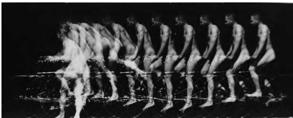
Abb. 2 Étienne-Jules Marey, Homme nu descendant de bicyclette . 1891. Schwarz-Weiß-Fotografie. 13,1 × 18,2 cm. Paris, La Cinémathèque française